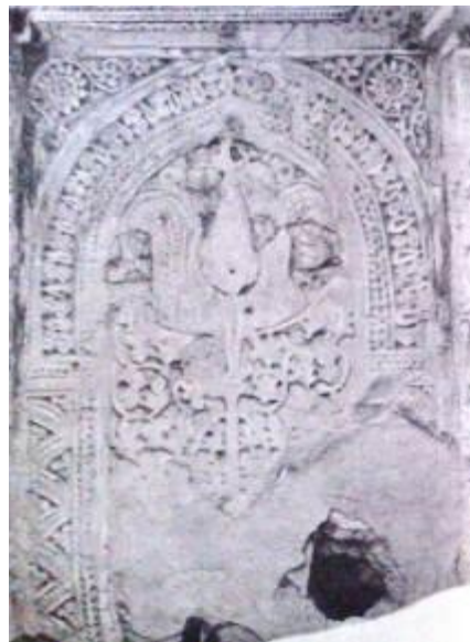
تصویر شماره ۱۰: طاقنمای درونی محراب امامزاده (Smith&Herzfeld, 1935: 85).

کارشده است که قسمتی از این حاشیه نیز آسیب دیده است (صاحبی بزاز، ۱۳۸۹: ۸۳- آبیاری، ۱۳۸۱: ۸۱). در پیشانی محراب، درون یک قاب مستطیل شکل به خط نسخ عبارت " و قوموالله قانتین هذا عماره المحراب العبد المذنب علی بن شیرزاد الانصاری القزوینی فی جمادی الاخر سنه ثمان و عشرين و خمسمائة نوشته شده است (آبیاری، ۱۳۸۱: ۸۱). در پیشانی محراب درون یک قاب مستطیل شکل آیه ۲۸ سوره بقره " کیف تکفرون بالله و کنتم امواتاً فاحیاکم ثم یمیتکم ثم یحییکم ثم الیه ترجعون " کتابت شده است (صاحبی بزاز، ۱۳۸۹: ۸۳- تصاویر و طرح شماره ۱۱).