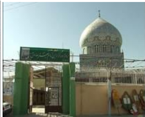
تصاویر شماره ۱: راست: نمایی از امامزاده کرار (بنای فعلی) - چپ: ضریح امامزاده

ساخته شده و در سال ۷۱۳ هـ. ق تعمیر گردیده است. کتیبه‌های گچ‌بری و خرطوم‌های زوایای مسجد مجاور این امامزاده که پس از خراب شدن سه دیوار و تاق بنا در معرض نابودی بوده‌اند، به موزه ایران باستان انتقال داده شده‌اند. بر جبهه محراب به خط نسخ، تاریخ سال ۵۲۸ هـ. ق گچ‌بری شده است (آبیار، ۱۳۸۱: ۸۰).