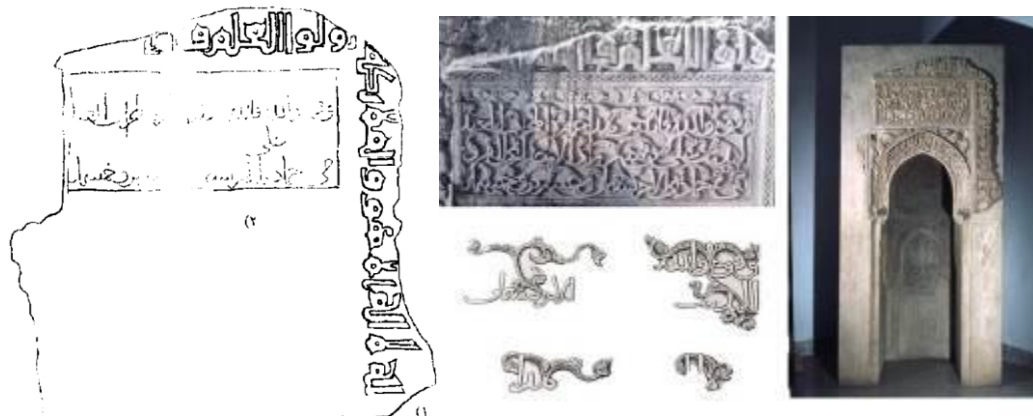
تصاویر و طرح شماره ۱۱: راست، محراب امامزاده کرار (موزه ملی)، کتیبه‌های نسخ تزئینی محراب - چپ: طرحی از کتیبه کناری محراب کرار (آبیار، ۱۳۸۱: ۸۱).

تپه حصار، تپه میل، چال ترخان، شوش، طاق بستان، قلعه هزار در نظام آباد، برزقاوله، قلعه گوری، قلعه یزدگرد، کیش و... با تزئینات گچبری بنای امامزاده کرار اصفهان، بازگوکننده تأثیر مستقیم هنر گچبری ساسانی بر هنر گچبری اسلامی است (جدول شماره ۱). در جدول شماره ۱، ضمن تفکیک نقوش تزئینی گچبری‌های بنای امامزاده کرار اصفهان، نمونه‌های مشابه آن‌ها را در تزئینات گچبری محوطه‌های دوره ساسانی ارائه گردیده است.