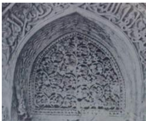
تصویر شماره ۹: نقوش تزئینی طاقنمای درونی محراب (Smith&Herzfeld. 1935: 83).

طاقنمای درونی محراب، محیط در قابی با نقوش مرواریدشکل، مزین به نقوشی چون درخت تاک، خوشه انگور و ساقه‌های موج کاملاً مشابه با نقوش