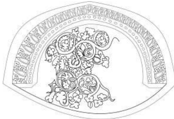
تصویر و طرح شماره ۳: نقوش گچ‌بری سکنج بنای امامزاده کرار (آرشیو موزه ملی - (Smith&Herzfeld. 1935: 87).

سکنج، دارای نقوش گیاهی پیچان (اسلیمی) است که شاخه‌های آن ختم به غنچه‌های روزت سه، چهار و پنج لپی می‌شود. این ردیف، فضای بیشتری از قاب بیرونی سکنج را بخود اختصاص داده است. دو ردیف باقی‌مانده نقوش دایره‌ای چسبیده بهم و بصورت دالبری و متحدالمرکز هستند. فضای درونی هر دو نمونه سکنج، سراسر پوشیده از نقوش گیاهی درخت تاک است. در مرکز نقش ساقه درخت تاک، ضمن تقسیم فضا به دو قسمت مساوی، دارای