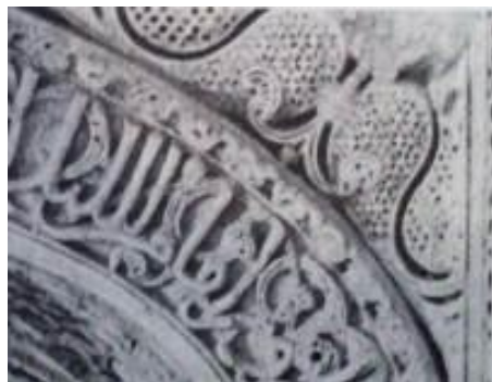
تصویر شماره ۷: لچکی محراب امامزاده کرار.

لچکی‌های محراب غنچه گل لاله‌ای است که انتهای شکوفه آن به برگ‌های کنگر ختم می‌شود. این غنچه