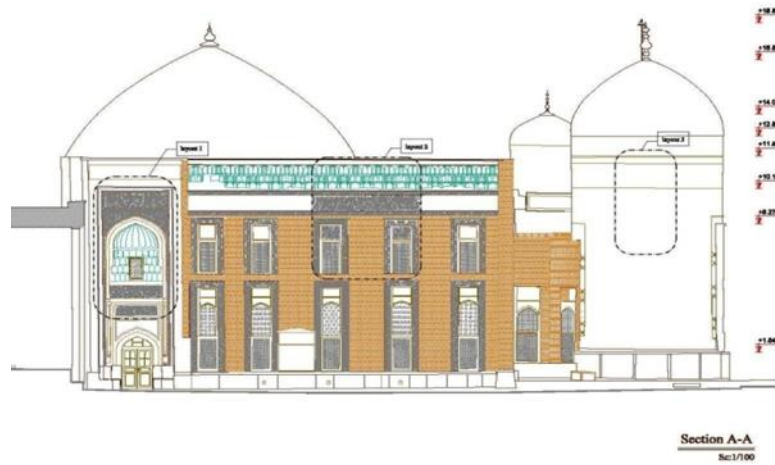
تصویر شماره ۳. موقعیت شاه‌نشین در نقشه مجموعه (مرکز اسناد میراث فرهنگی)