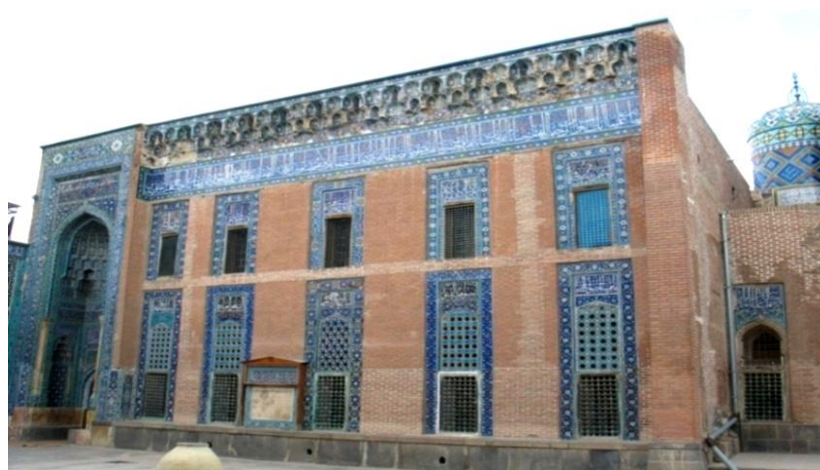
تصویر شماره ۲. نمای تالار دارالحفاظ از صحن