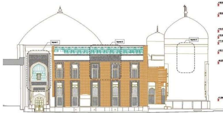
Section A-A Scale: 1/100

تصویر شماره ۳. موقعیت شاه‌نشین در نقشه مجموعه (مرکز اسناد میراث فرهنگی)